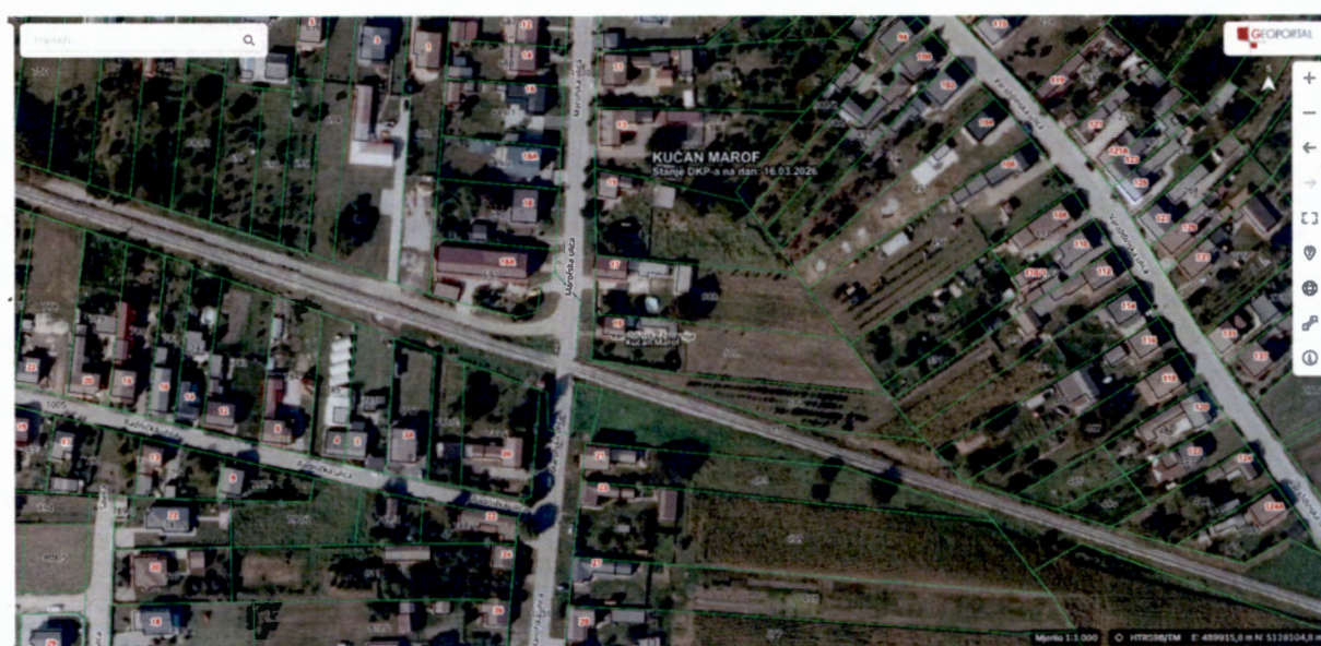
Slika 2. ŽCP Kućan Marof 1

Za željezničko-cestovne prijelaze u naselju Kućan Marof 1 i 2 (Slika 2. i Slika 3.), očitovali su se: „ŽCP je osiguran svjetlosnom i zvučnom signalizacijom te polubranicama.“