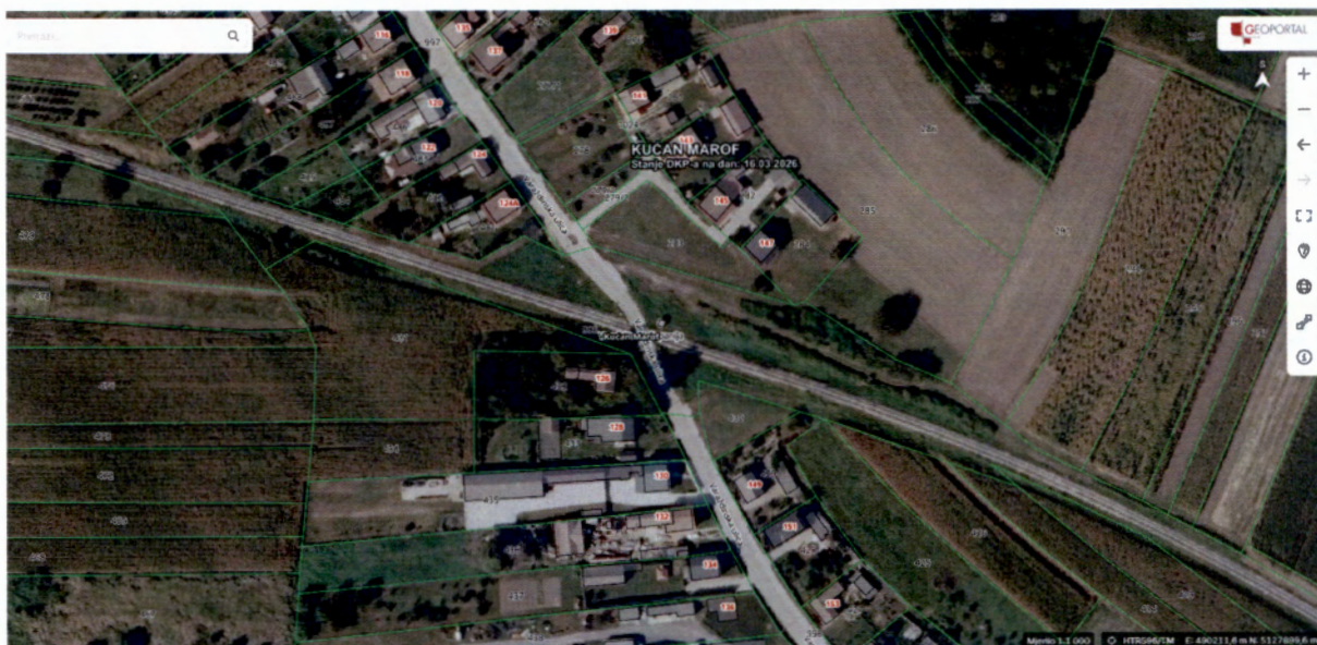
Slika 3. ŽCP Kućan Marof 2

U prilogu odgovora dostavljam zaprimljeno očitovanje od HŽ Infrastrukture.